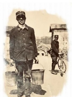
Les Éditions PIAMO

« J'ai choisi de mettre en scène cette histoire-là car Béruges est chargé d'une affection toute particulière pour moi. J'y ai passé mes grandes vacances quand j'étais adolescent. »